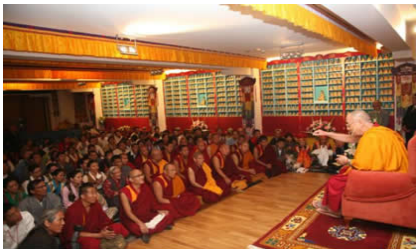
El Dalai Lama beneeix la Gompa de la Fundació Casa del Tibet i rep en audiència a la Comunitat Tibetana. Barcelona, 11 de setembre de 2007

A continuació Sa Santedat rebé als membres de la Comunitat Tibetana de Catalunya i d'Espanya i alguns altres exiliats vinguts de diferents països d'Europa, als quals recordà la importància de la preservació de la tradició cultural tibetana, mantenint el procés d'enriquiment i intercanvi mutu amb el país d'acollida. Va també emfasitzar que en tot moment fóssin conscients de les dificultats actuals que estan visquent els seus germans i compatriotes en el territori del Tibet.