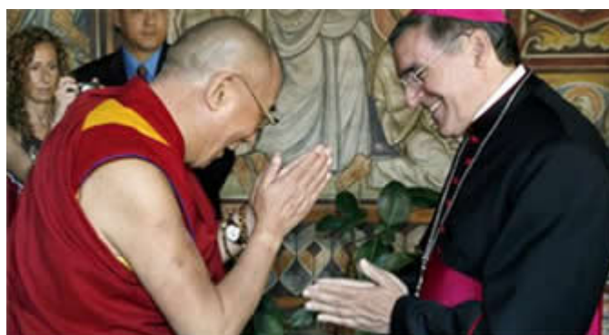
Rev. Mn. Lluís Martínez Sistachs i Sa Santedat Dalai Lama. Arquebisbat de Barcelona

Ambdós varen tractar de temes relacionats amb la espiritualitat i la necessitat d'un diàleg sobre la fe comuna. Ambdós intercanviaren les reflexions espirituals comunes i valoraren positivament el diàleg interreligiós i especialment la col.laboració entre catòlics i budistes.